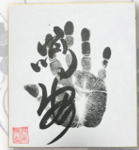
●力士直筆サイン例