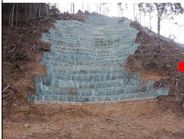
R3年 3月撮影 (工事完了直後)