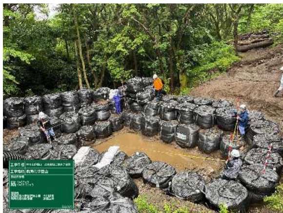
⑦下部 仮設沈砂池設置状況