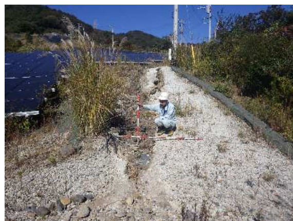
太陽光発電施設 状況確認