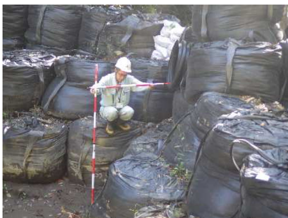
仮設沈砂池 堆砂状況