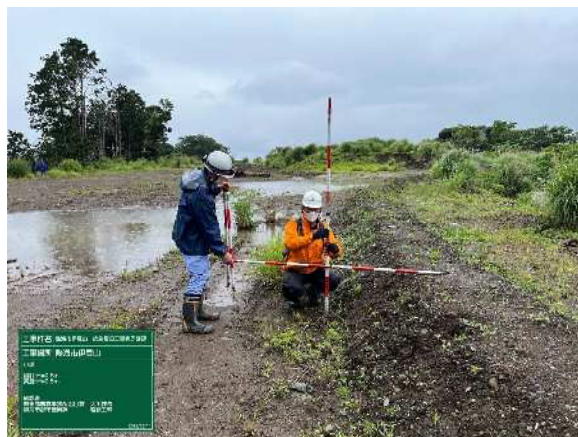
③上部 小堤設置状況