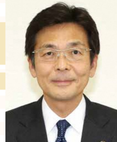
熱海市長 齊藤 栄