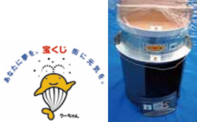
下記の部分は、お店・企業の広告枠です。

一般財団法人自治総合センターが行う、令和4年度コミュニティ助成事業による宝くじの助成金で、上小嵐町内会が集会所などの備品を整備しました。