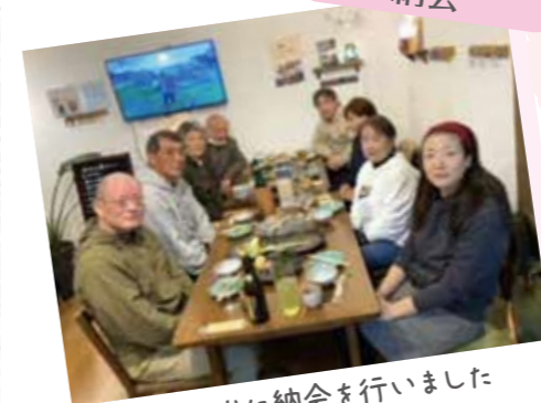
2年ぶりに納会を行いました