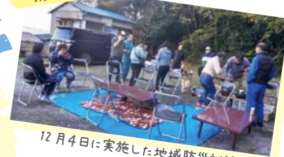
12月4日に実施した地域防災訓練