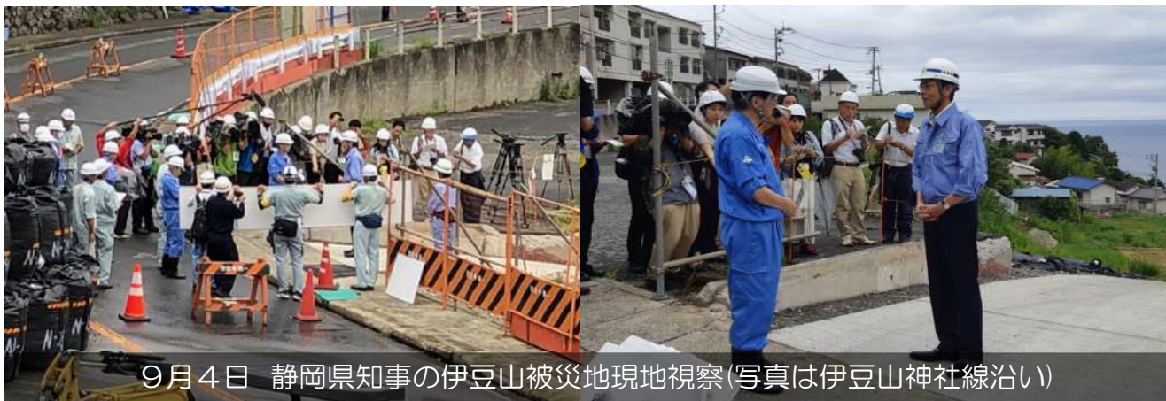
9月4日 静岡県知事の伊豆山被災地現地視察(写真は伊豆山神社線沿い)

9月4日14時30分より、静岡県知事の川勝平太氏による被災地の視察が行われました。