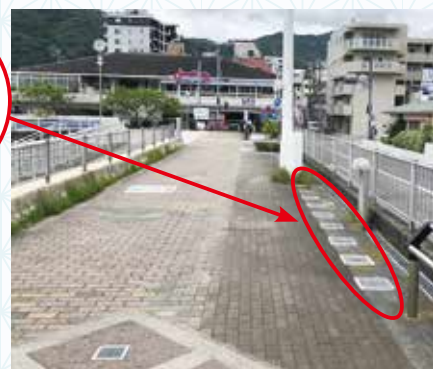
昨年度の記念プレート(写真上) プレート設置状況(写真右)

サンビーチ遊歩道に成人式記念プレートが設置されているのを知っていますか? プレートを設置するようになったのは20年前の2000年(平成12年)の成人式からです。当初は市の木や花、文化財など絵柄がデザインされていました。2010年(平成22年)から現在の「新成人」が刻まれたものになりました。サンビーチにお出かけの際はぜひご覧ください。