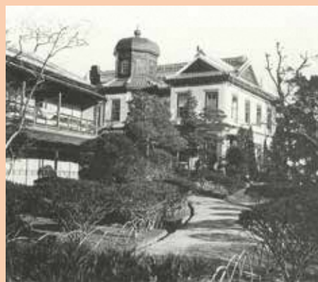
樋口ホテル

モダンな外観をもつこのホテルは、食事の調え方についても、①これまで同様に客人が自分で用意する、②ホテルがその都度客人の好みを聞いて料理を出す、