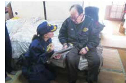
高齢者宅防火訪問

高齢者宅防火訪問では住宅防火対策の推進のため、民生委員や消防団女性部と合同で、市内に居住する高齢者宅を訪問し、住宅用火災警報器の設置や維持管理についての説明やお手伝いをしています。