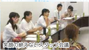
笑顔の絶えないスタッフ会議