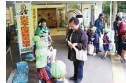
幼年消防クラブ員による火災予防啓発運動