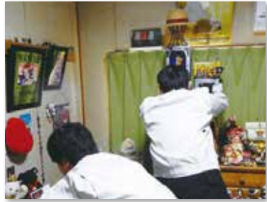
土地・建物公売の実施