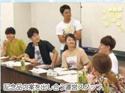
記念品の案を出し合う運営スタッフ

令和2年成人式に向けて活動中の運営スタッフ会議、今月号では、会議の様子をご紹介します。 会議では、役割分担、記念品の選定、オープニングイベント、新成人プログラム、記念冊子の編集など、決めなくてはならないことがたくさんあります。 スタッフの11人は出身中学校の枠を超えて和気あいあいと話し合いを進めています。これまで4回の会議を経て、徐々に大枠が見えてきました。スタッフ会議は12月までの全7回、この良い雰囲気のまま成人式を迎えたいですね。