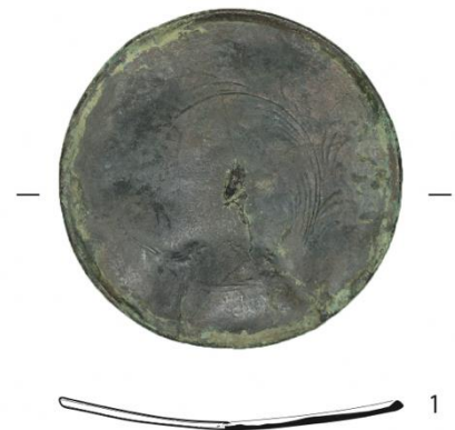
永満寺経塚出土鏡 天永元(1110)年銘

例も知られるが、和鏡を伴う例が最も多い。湖州鏡は、中国浙江省湖州で製作されたもので、素文の鏡背には「湖州真正石念二叔照子」なども文字が陽鑄され、円形、方形、六角形、六花形、八花形、猪目形などが認められる。島根県出雲市鱒淵寺(仁平2(1152)年)や和歌山県新宮市神倉山経塚等で知られる。唐式鏡の共伴例は山口県光市堂森の瑞花鴛鴦八稜鏡が知られ、漢式鏡は京都市東山区清水寺などで検出されている。和鏡は、多くの経塚の共伴遺物として知られ、福岡市香椎宮境内経塚出土の瑞花双鳳鏡などは、承暦2(1078)年の紀年銘を有する経筒と搬出して古い共伴例の一つである。