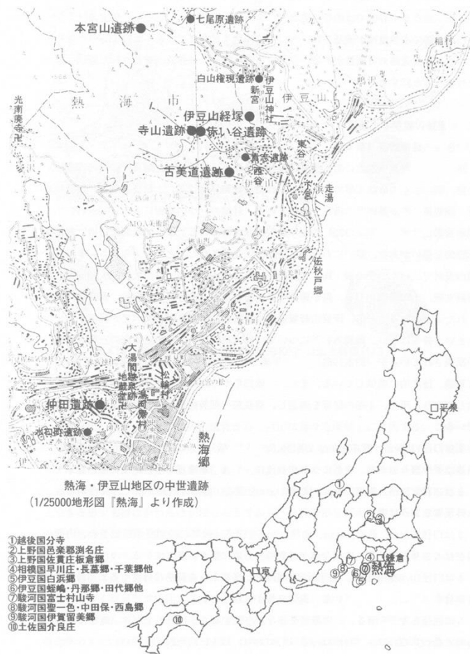
中世走湯山所領分布図（栗木 2004）