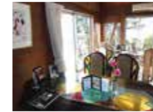
創作の家 リビングの写真