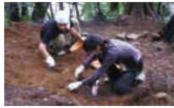
伊豆山経塚発掘調査風景