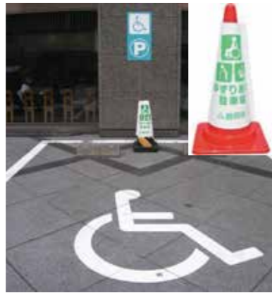
静岡県ゆずりあい駐車場

ヘルプマークをつけている人を見かけたら、電車・バスの中では席を譲る、駅や商業施設などでは困っていたら声をかける、災害時は安全に逃げるための支援をする、といったご協力をお願いします。