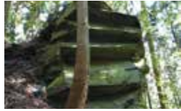
埼玉県指定旧跡板石塔石材採掘遺跡