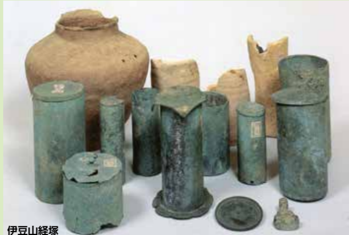
伊豆山経塚 ※経塚とは末法思想によりお経を埋めたタイムカプセルのようなもの