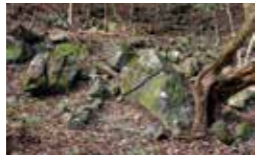
江戸城石丁場跡(中張窪石丁場跡)