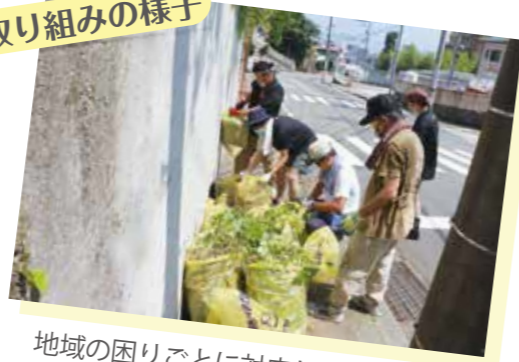
地域の困りごとに対応しています