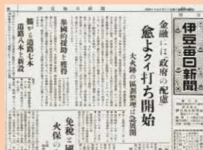
区画整理の「クイ打ち」を伝える新聞(昭和25年4月19日付) 問い合わせ 歴史資料管理室 ☎0557(48)7100

熱海大火(昭和25年)後、大火となった大きな原因として指摘されたのが、「狭い道路」と「密集した建物」でした。 熱海の街は昔から傾斜地と丘が入り組み、自然の地形に沿ってできた道路は曲線路や狭い道がほとんどでした。そのため、大火当時、交互通行が自由にできる広い道路は皆無だったといわれています。また、丹那トンネルの開通により観光客や流入者が急増した昭和初期以降、温泉街周辺は無秩序に家屋が密集する状態となっていました。 大火から2日後の4月15日、この悲劇を二度と繰り返すまいと、建設省や県、市の幹部らによって市街地の再建案が夜を徹して協議されました。その結果、懸案だった都市計画を断行して復興をめざす案がまとまり、16日の市議会に発表されました。その内容は、海岸通りや銀座通りを防火地区、その他多くの区域を準防火地区に指定し、幹線道路は12m、15m幅とし、糸川や初川の両側に6m幅の遊歩道を設けるなど、防火対策に徹底したものでした。 この再建案は大規模な区画整理を伴