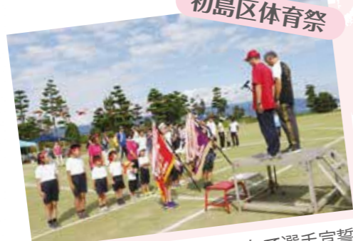
子どもから大人まで、みんなで選手宣誓