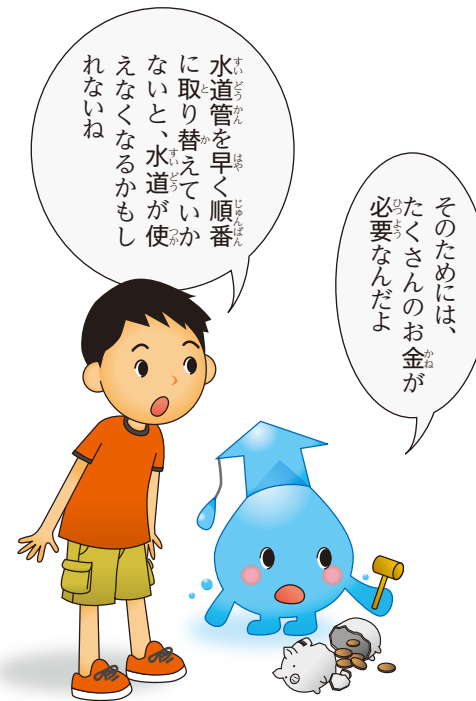
古い水道施設の取り替えに必要な費用

国の想定では、2025年頃(H37年)には水道施設の建設に使える費用が古い水道施設の取り替えに必要な費用に対して不足すると予測されています。次の世代に安心できる水道を残すために、今から、計画的な取り替えが必要です。