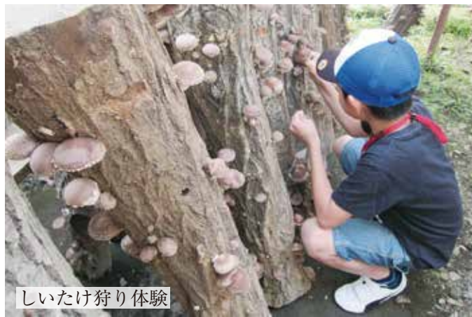
しいたけ狩り体験

「食の多様化が進む時代ですが、日本に古くから根付いている「和食文化」を次世代に継承することは、健康づくりの基本である日本型食生活を守ることにつながります。