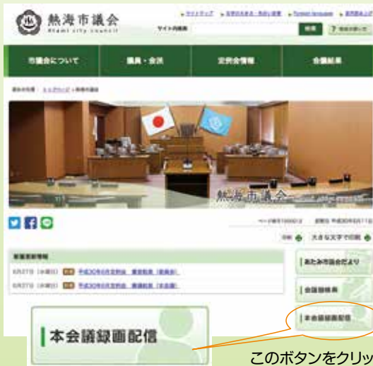
このボタンをクリック