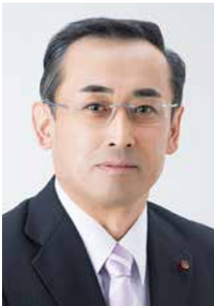
よ ね や ま ひ で お 米山秀夫 議員