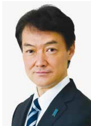
はしもとかずみ 橋本一実 議員