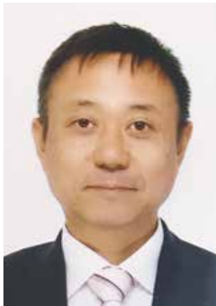
あか こういち 赤尾光一 議員