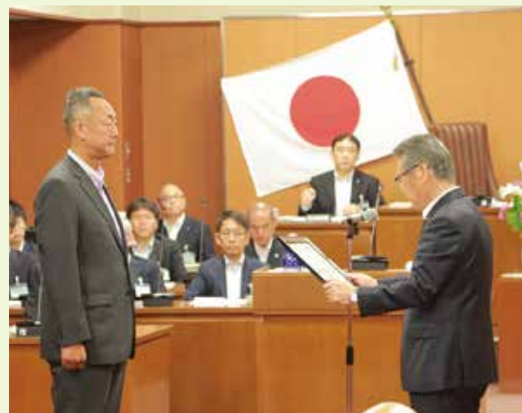
越村修議員【第81代副議長】