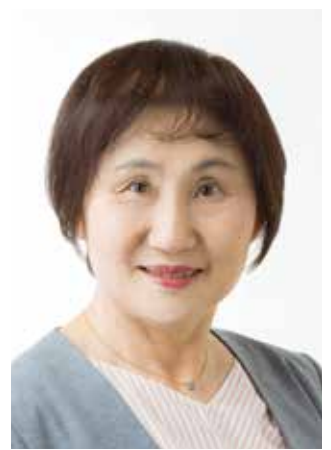
こ さ か さ ち え 小坂幸枝 議員