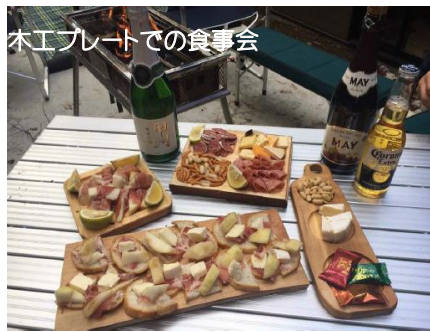
木エプレートでの食事会