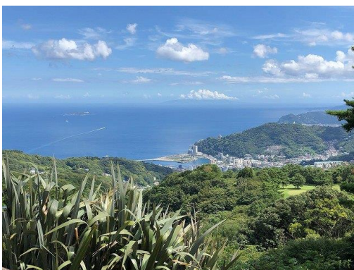
山から見る熱海の景色