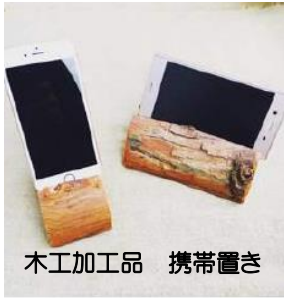
木工加工品 携帯置き