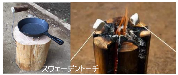
スウェーデントーチ