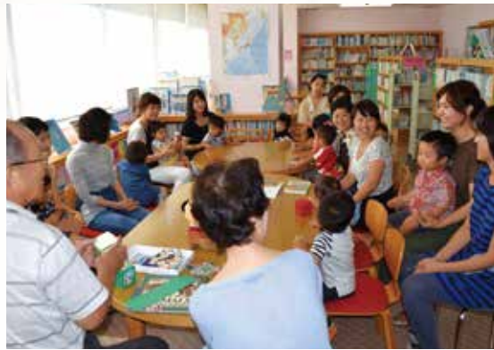
会話が出来る児童室の様子

代には6冊以内、現在は10冊以内となり、利用者にとっては大変便利になりました。また、図書館利用者カードの対象も、以前は小学生からでしたが、現在ではゼロ歳児からの利用が可能となりました。お母さんと子どもたちが周囲を気にしないで話をする事ができる「会話ができて児童室(試行)」も始まりました。