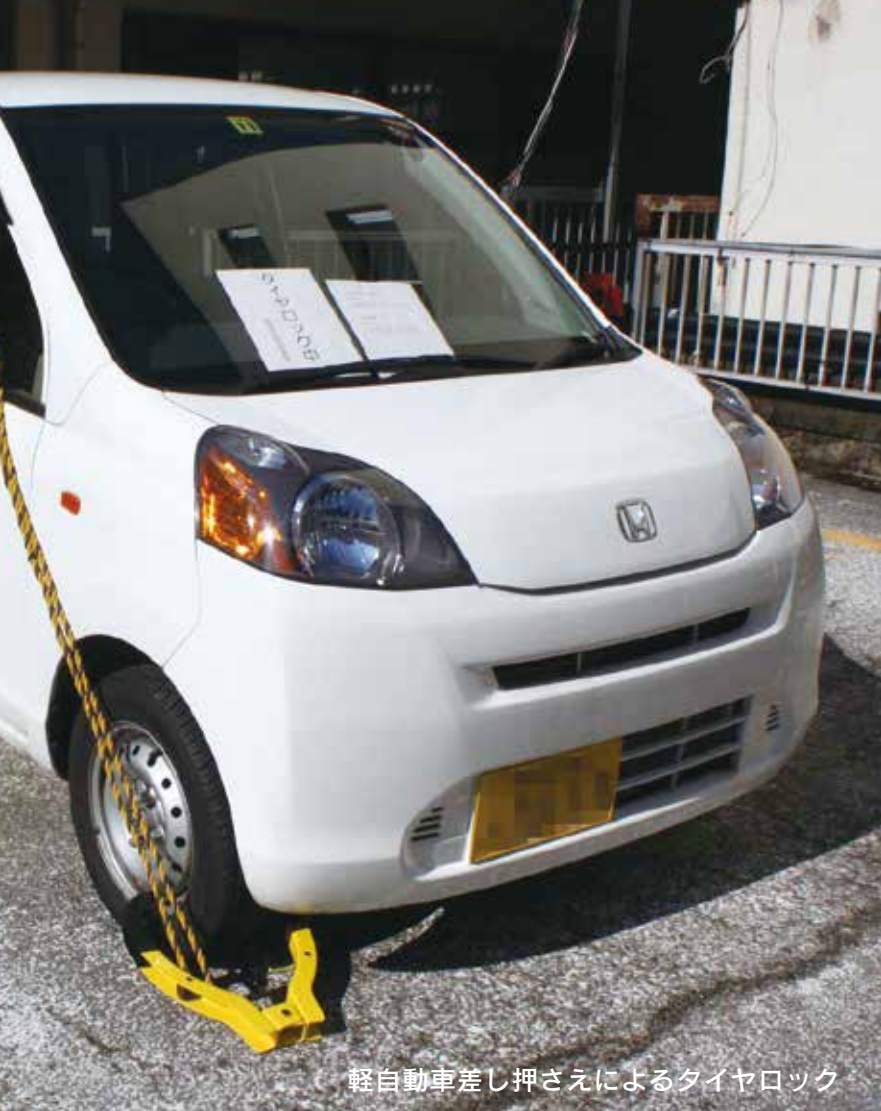
軽自動車差し押さえによるタイヤロック