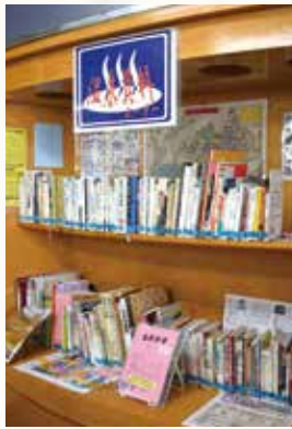
温泉資料コーナー

熱海市は温泉と観光の街です。逍遙の残した蔵書や観光資料をはじめこれまで集められた歴史資料は熱海の大切な財産として所蔵されています。現在では熱海市立図書館のシンボルとして4階の中央部に「温泉資料コーナー」を常設し、温泉の資料を集約することにより、一人でも多くの人に温泉の魅力を知ってもらえるようにしました。