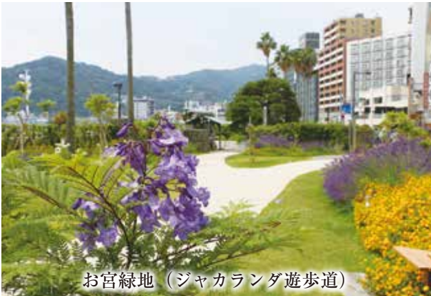
お宮緑地（ジャカラランダ遊歩道）