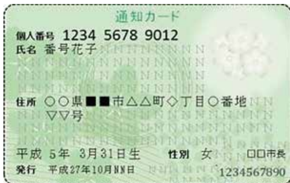
個人番号通知カード(イメージ)

紛失した場合は、再発行されるまでに時間がかかることがありますのでご注意ください。