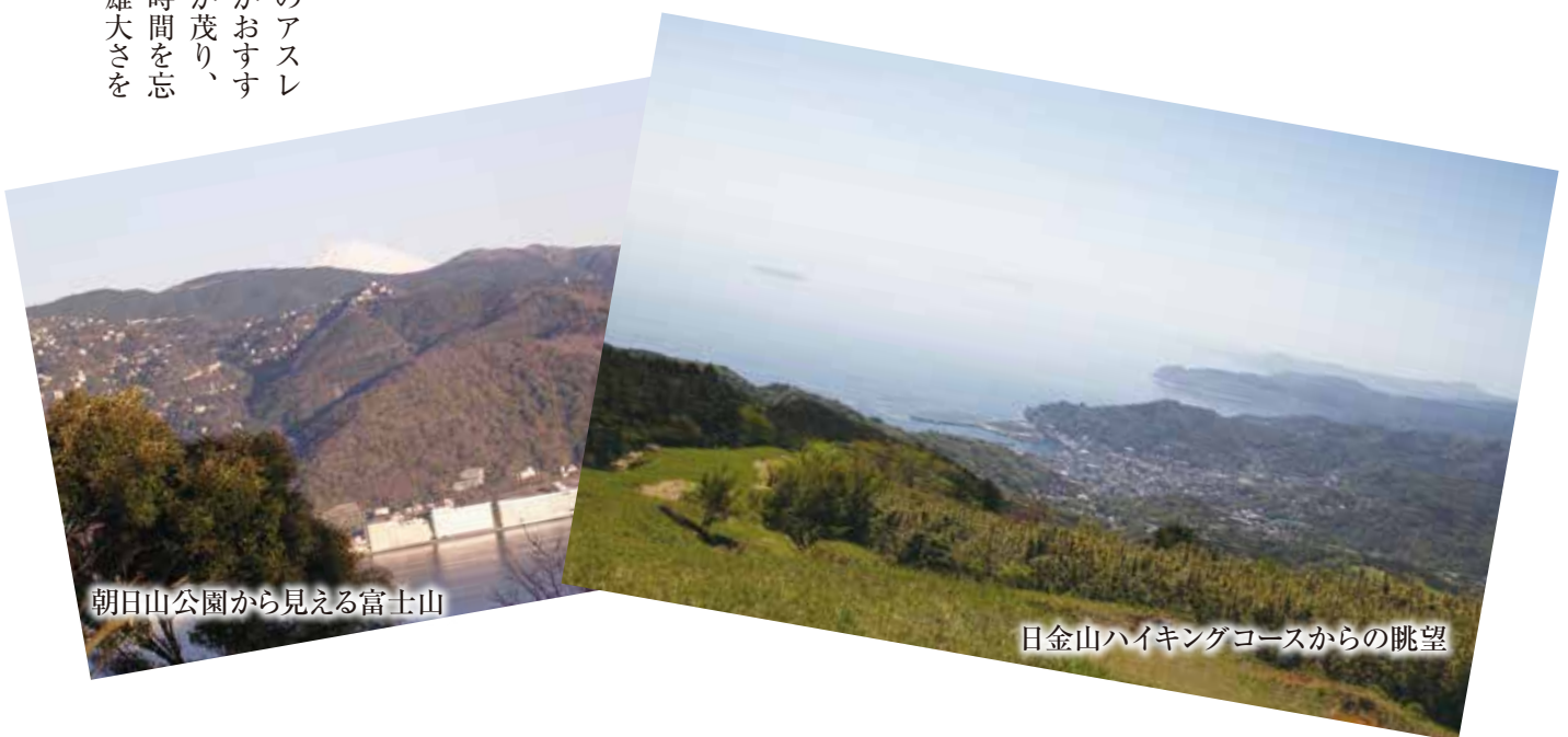
朝日山公園から見える富士山

行動派には、姫の沢公園のアスレ チック・ハイキングコースがおすす めです。古道の両脇に樹木が茂り、 合い間から開ける眺望は、時間を忘 れさせてくれます。自然の雄大さを 感じる至福のひと時です。