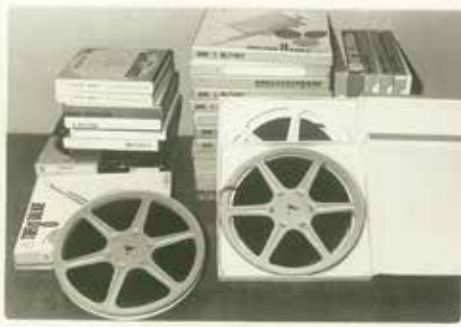
目を輝かせて楽しんだ8ミリフィルム

宇宙戦艦ヤマト・鶴の恩返し・名犬ラッシー・ナイチンゲールなどの名作8ミリフィルムが、子ども会や保育園、各団体に貸し出され、目を輝かせて見る子どもたちの姿がありました。