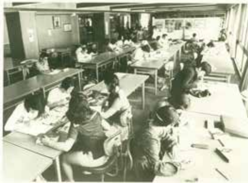
初めて完備された吹き抜けの閲覧室で楽しむ様子

資料室が設けられたことにより、熱海の歴史を学ぼうとする市民も増え、新しい図書館では市民と資料を結ぶレファレンス業務も積極的に行われるようになりました。