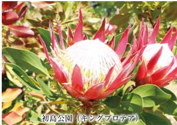
初島公園（キングプロテア）

【キングプロテア】 南アフリカ原産の常緑低木で、初島公園には約220本が植栽されています。南国ムード溢れるエキゾチックな形で「花の王様」と称されています。