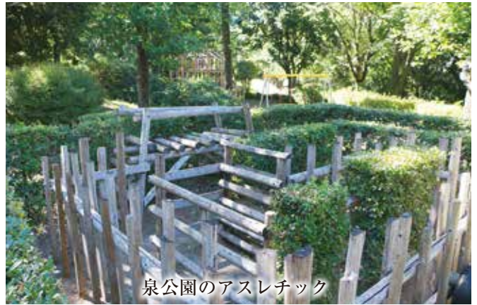
泉公園のアスレチック