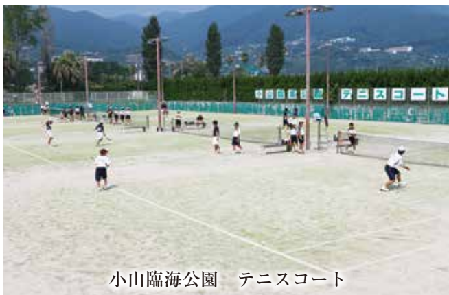
小山臨海公園 テニスコート

姫の沢公園には、サッカー・グラウンドゴルフ・フットサルなどができる人工芝のスポーツ広場があります。