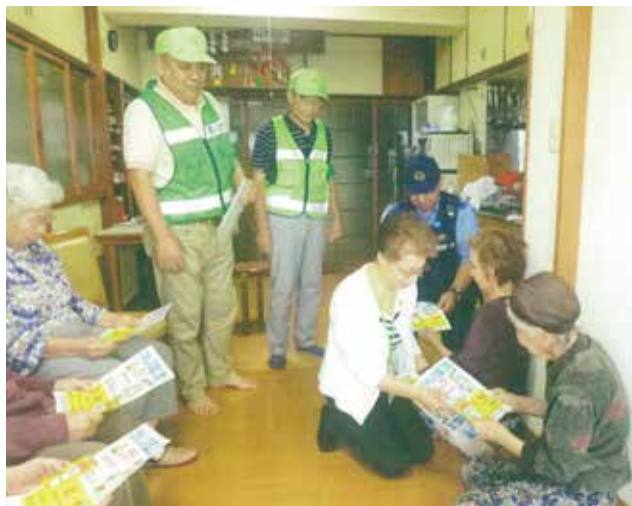
▶ 高齢者に対する 特殊詐欺被害防止キャンペーンへの協力