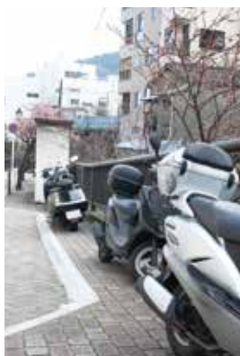
▲歩道をふさぐバイク

それ以外では、歩道をふさぐように物が置かれていたり、私たちがのように目が見えていれば回避できますけれども、車いすの人や目の見えない人はそうもいきませんから非常に困りますね。