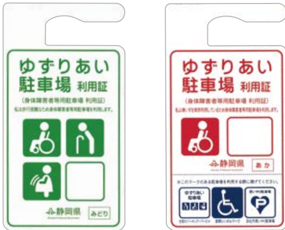
▲ゆずりあい駐車場利用証（みどり・あか）

現在、静岡県内では「ゆずりあい駐車場制度」が実施されています。これは、車いすのマークがついている「身体障害者等用駐車場」や施設の入口付近に設置されている「ゆずりあい駐車場」を本当に必要としている人が使えるよう、歩行が困難な人などに利用証を交付し、駐車するときに車内に掲げてもらうことで、不適切な駐車を抑制する取り組みです。