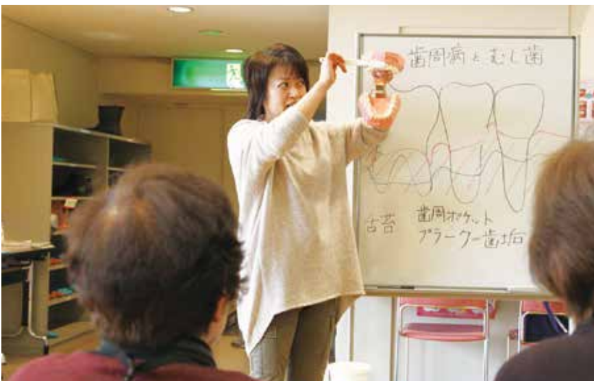
▲「お口元氣教室」で口腔ケアの方法について学ぶ受講者

その他、選択式のアンケートでは「食事がよりおいしくなった」「薄味がわかるようになった」という項目に○をつける人が多くいらっしゃいました。適切な口腔ケアや唾液腺マッサージにより、口腔乾燥が改善し、以前と比べて味がわかるようになったということです。