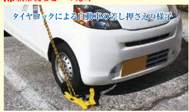
タイヤロックによる自動車の差し押さえの様子