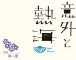
意外と熱海ブランドブック