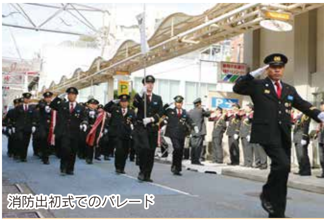
消防出初式でのパレード