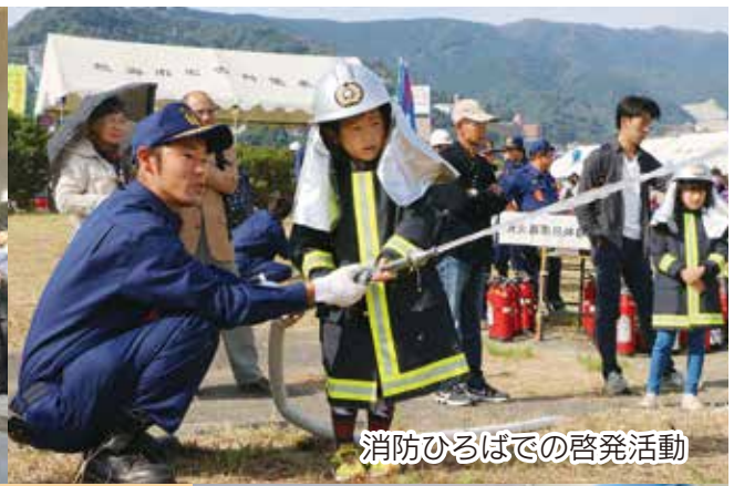
消防ひろばでの啓発活動