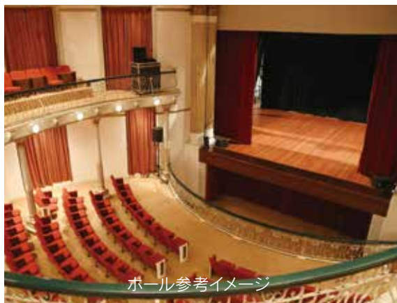
ホール参考イメージ

◇利用者に配慮した舞台、楽屋、リハーサル室、音響設備を備えた400人以上収容の市民ホール