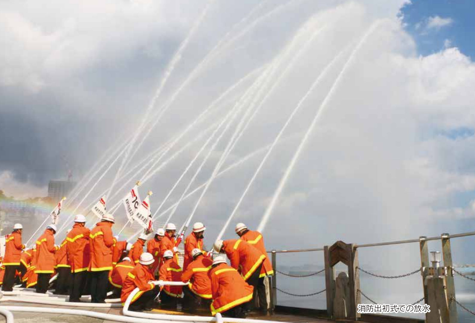
消防出初式での放水