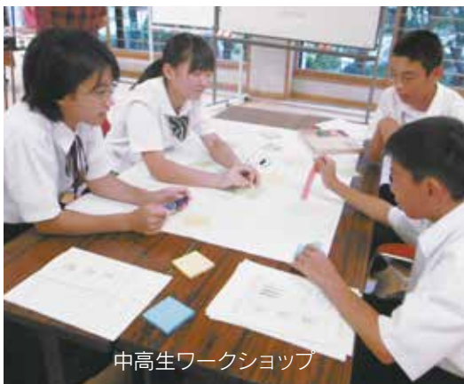
中高生ワークショップ

ワークショップなどの開催により市民ニーズの聴取やさまざまな団体から要望をいただきました。これらのニーズや将来的な財政状況、既