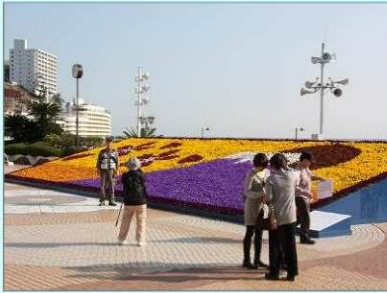
花のまちづくり推進事業