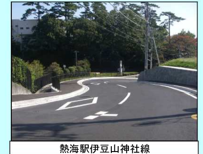
熱海駅伊豆山神社線

まちの課題の変化 ・糸川遊歩道の歩行者数が増加し、本来熱海を持つ魅力と活力及び賑わいの再生の端緒となった。 ・糸川遊歩道に対する沿道住民・事業者の満足度が向上するなど、市民及び来訪者が「歩いてみたくなる都市空間」が創出された。今後は、夜間の魅力向上や雨天時の安心感確保が課題である。