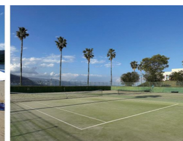
市営テニスコート