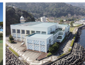
南熱海マリンホール